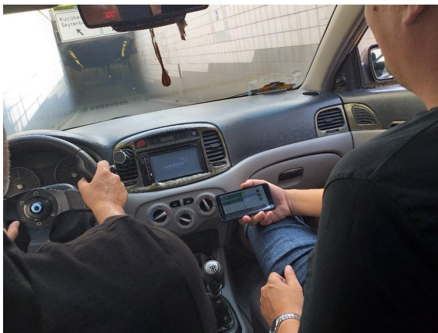
7. ábra: Az érdemi kommunikáció hiányában a mobiltelefon GPS-ével tájékozódik a taxisofőr is

A törökök általános nyelvtudásával kapcsolatban azt mindenképp érdemes kiemelni, hogy bár nagy világnyelveket relatíve kis százalékban beszélnek második nyelvként, azonban az olyan területeken, ahol nagyarányú valamilyen kisebbség, ott nyilvánvalóan kialakult egy bilingvis kisebbség, így ezeken a helyeken magas az idegen nyelvet (második nyelvet) beszélők aránya – ez azonban nem könnyíti meg az európai és észak-amerikai turistákkal történő kommunikációt (Ürmösné, 2012, 2014).