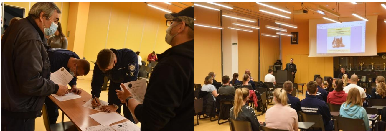
Rendészeti Kutyás Szakosztály toborzó 88