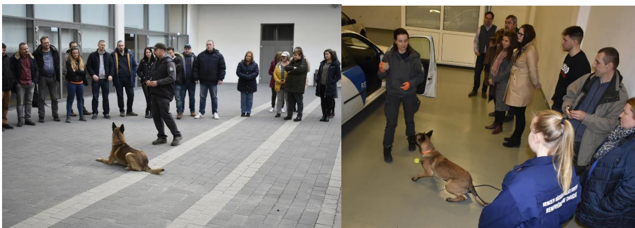
NNI kutyás bemutató 79

Abban a megtiszteltetésben is volt részünk, hogy rendszeres vendégünknek mondhattuk a Nemzeti Nyomozóiroda Bűnügyi Technikai Főosztályán tevékenykedő igen kiváló kollégákat is. Ezen a szakmai csúcsponton még a legmagasabb szinten is nagyon komoly gyakorlati szakmai tudással és előadókészséggel találkozhattak a hallgatónk. A bemutatók során a résztvevők megismerkedhettek a „ bűnügyi szolgálati kutyás szakirányító tevékenységével, a szolgálati kutyák képzésének a rejtelmeivel és a kiképzett kutyák által végzett igen értékes munkával ”. 78