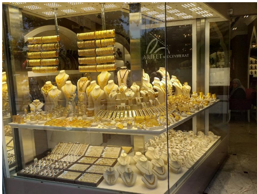
6. ábra: Arany(?) ékszereket áruló üzlet Ankara belvárosában