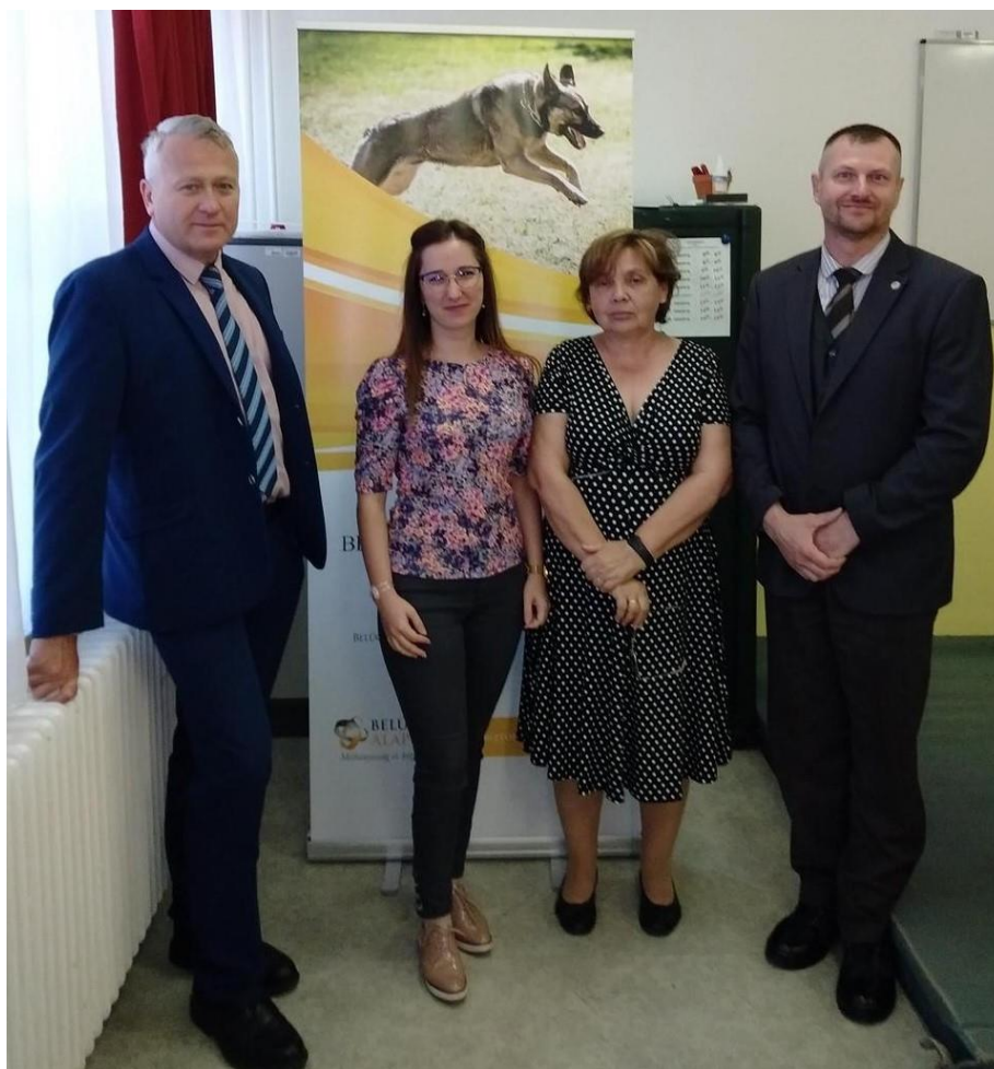
BBA projektmegbeszélés Dunakeszi 94

További nagyon öröndetes eredmény, hogy a szolgálati kutyás témában számos szakdolgozat és diplomamunka született az évek során minden félévben. Mindez történt annak ellenére is, hogy a járványügyi helyzet nagyon megnehezítette a személyes kontaktuson alapuló kutatásokat. Jelen félévben is szerencsésen elkészült három remekmű a tárgyban.