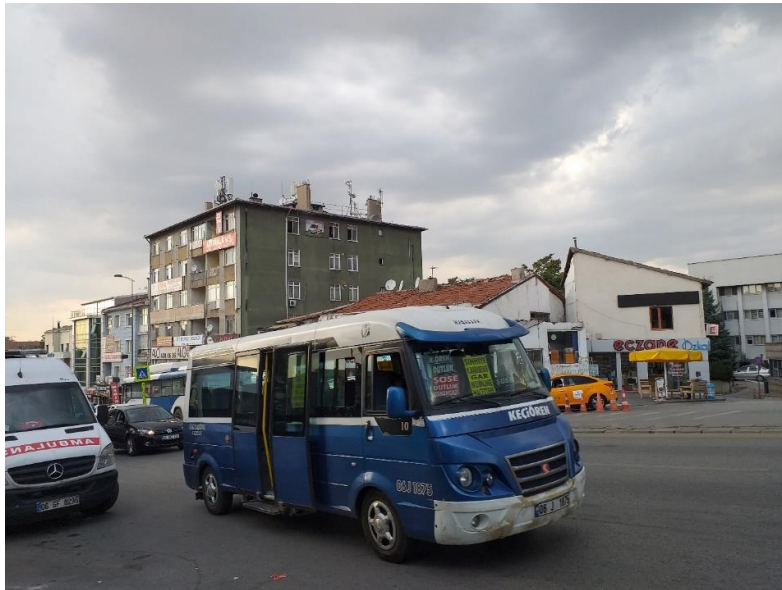
3. ábra: Nyitott ajtókkal közlekedő, személyszállítást végző kisbusz

A közlekedésbiztonság szempontjából mindenképp pozitív tényként értékelhető, hogy Törökországban nem általános az alkoholos italok fogyasztása. A konzervatívabb felfogású Ankarára pedig még inkább igaz ez, mint például Isztambulban. Az alkohol, mint oksági tényező tehát elhanyagolható szerepet játszik a balesetekben.