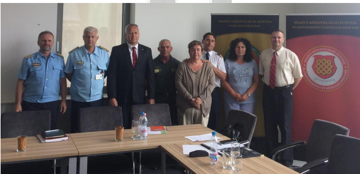
NKE SE Rendészeti Kutyás Szakosztály alakuló ülése 85