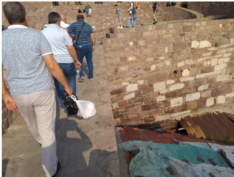
5. ábra: Az életveszélyes ankarai citadella, figyelmeztető táblák és korlát nélkül.

Műszaki biztonság alatt azokat a veszélyforrásokat értjük, amelyek a turistákat érhetik a különféle eszközök, berendezések, közlekedési eszközök stb. használata során. A jóval a török fejlettségi szint felett lévő Ankarában is találkozhatunk pl. olyan tömegközlekedési eszközökkel, taxikkal, amelyek műszaki színvonala az EU-s normákat figyelembe véve, biztosan nem kapnák meg a hatósági engedélyt a közúti közlekedésben való részvételre. A nyilvánvalóan alacsonyabb gazdasági fejlettség foka az, amely sok esetben eredményezi a járdák és útburkolatok gyengébb minőségét, a biztosító eszközök hiányát stb., amelyek ugyancsak számos baleset forrásai lehetnek (5. ábra).