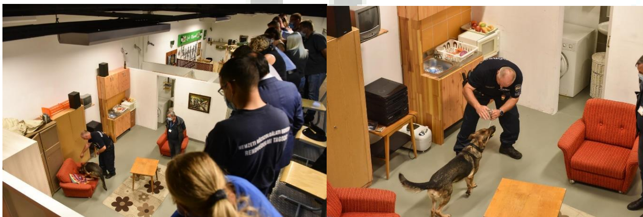
Bemutató Taktikai Házban 81

A gyakorlati képzés bemutatására igen jó lehetőséget teremtett a számunkra a Rendészeti Oktatási Épület és Kollégium objektumában elhelyezkedő Taktikai Házunk, ahol akár egy magánlakás, akár egy vendéglátóipari egység, vagy akár egy bank épületében történő intézkedéseket is „eljátszhatunk”.