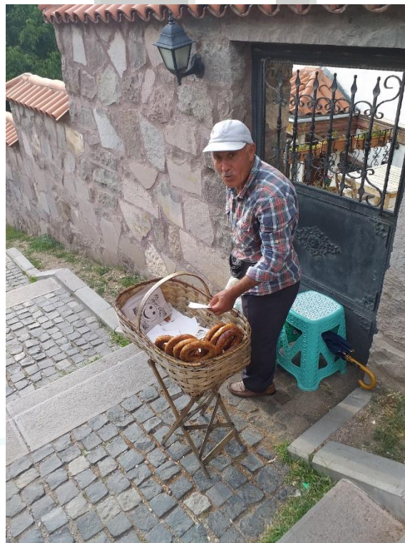
4. ábra: A perecét áruló utcai árus (Ankara)

Az Ankarába látogató turista jelentős egészségügyi kockázattal nem szembesül, azonban még egy török viszonylatban fejlett település esetében sem ajánlott a csapvíz fogyasztása, illetve ajánlott bizonyos oltások felvétele (pl. Hepatitis A és B, hastífusz, diftéria-tetanusz, veszettség) ( https://konzuliszolgalat.kormany.hu ). Az egészségbiztonság területén elsősorban az általános higiéniai viszonyok említendők meg, mint kockázati tényezők. Semmiképp sem veszélyként kell értékelni az ankarai higiéniai viszonyokat, inkább kockázati tényezőnek, de azt kijelenthetjük, hogy a higiéniai szabályokat jóval könnyedebben értelmezik, mint az EU országainak többségében megszokott (4. ábra).