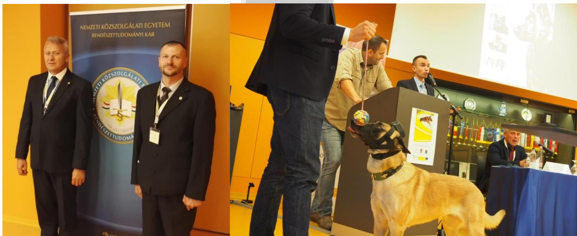
KYNOPOL konferencia 2018 90

A szakosztály közreműködésével került megtartásra a Nemzeti Közsolgálati Egyetemen - 2018. október 16 és 17. között 20 ország részvételével – a KYNOPOL (Network of Police Dog Professionals in Europe, Európai Rendvédelmi Kutyakiképzők Rendőrségi Hálózat Alcsoport, magyar képviselő: Rendőrségi Oktatási és Kiképző Központ) konferencia a BBA-5.2.1/3-2017- 00002 azonosító számú „Együttműködés a kutyavezetők között, szolgálati kutyák kiképzése terén” projekt keretében. 89