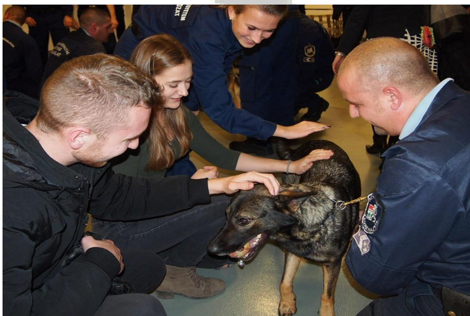
A program legjobb része: a kutyasimogatás 74

A vírushelyzet előtti időkben megvolt a lehetőségünk arra, hogy az egyes témakörök átbeszélést követően a meghívott kutyás kollégák a kurzus keretében mutassák be a gyakorlati végrehajtást. Ezekben a bemutatókon soha nem elégedtünk meg azzal, hogy a hallgatók csupán külső szemlélők legyenek. Itt mindenkinek részt kellett venni, mivel az ilyen „kitűnő szakmai programot tovább színesítette, hogy a központ Dunakesziről érkező munkatársai még a nézők által simogatható kutyákat is hoztak magukkal. Hisz a tárgy legfontosabb része az állatok, a kutyák szeretete, a szolgálati kutyás képzés iránti motiváció és elkötelezettség kialakítása a hallgatókban”. 73