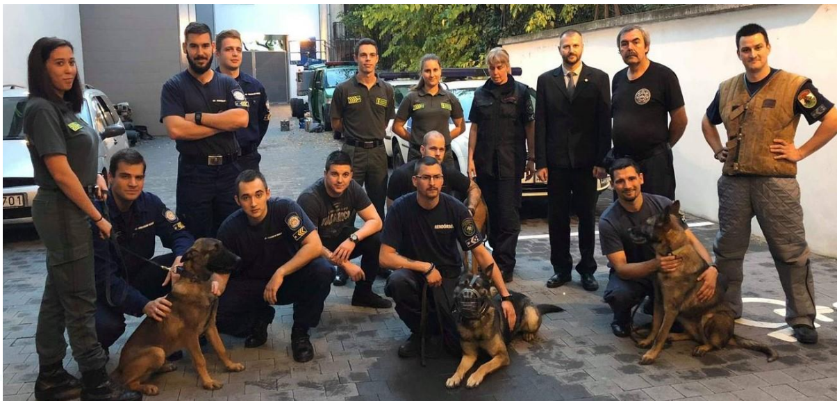
Szolgálati kutyás bemutató /2018/ 75

Természetesen arra is mindig törekedtünk, hogy az egyes alkalmazások a rendvédelmi paletta külön szegmenseiből is megvilágításra kerüljenek. Ennek okán mindig voltak olyan külön alkalmak is, amikor „a BVOP Biztonsági Szolgálat szolgálati kutyák alkalmazási szakirányításával foglalkozó munkatársa és kollégái ismertették tevékenységük normaháttérét, elméletét, a kutyák kiképzésekor alkalmazott legújabb technikákat”. 76