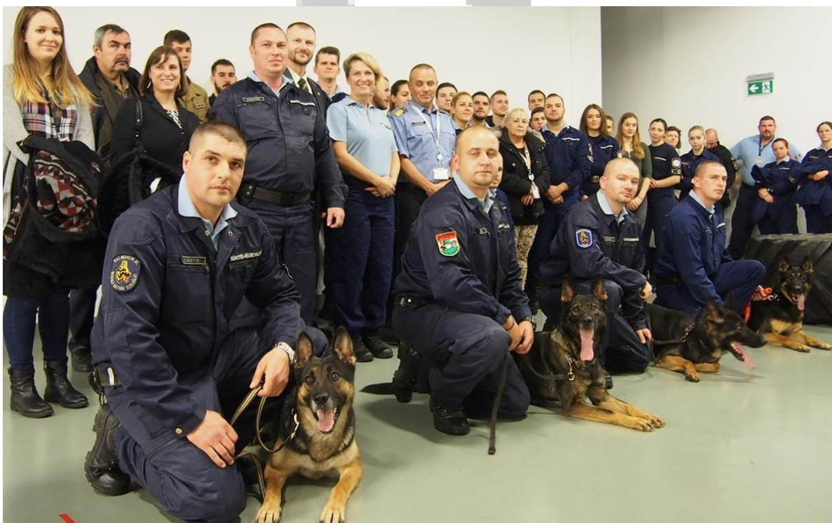
Bv-s szolgálati kutyás bemutató 77

Természetesen arra is mindig törekedtünk, hogy az egyes alkalmazások a rendvédelmi paletta külön szegmenseiből is megvilágításra kerüljenek. Ennek okán mindig voltak olyan külön alkalmak is, amikor „a BVOP Biztonsági Szolgálat szolgálati kutyák alkalmazási szakirányításával foglalkozó munkatársa és kollégái ismertették tevékenységük normaháttérét, elméletét, a kutyák kiképzésekor alkalmazott legújabb technikákat”. 76